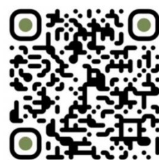
青少年夏令會報名

日期：7月17-19日 地點：香港明愛賽馬會長洲明暉營 對象：升中至大專生 費用：$850 (早鳥價$650，14/6前)